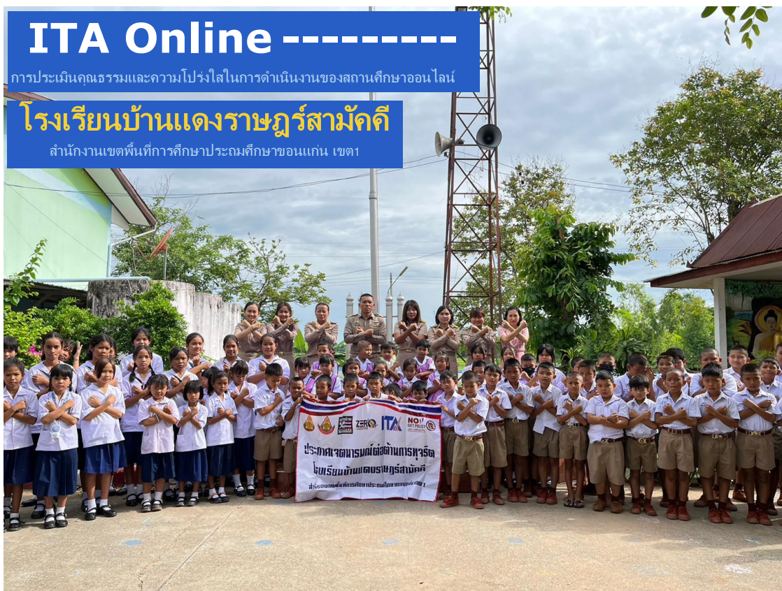
โรงเรียนบ้านแดงราษฎร์สามัคคี หมู่ที่ ๖ ตำบลบ้านเหล่า อำเภอบ้านฝาง จังหวัดขอนแก่น สำนักงานคณะกรรมการการศึกษาขั้นพื้นฐาน กระทรวงศึกษาธิการ